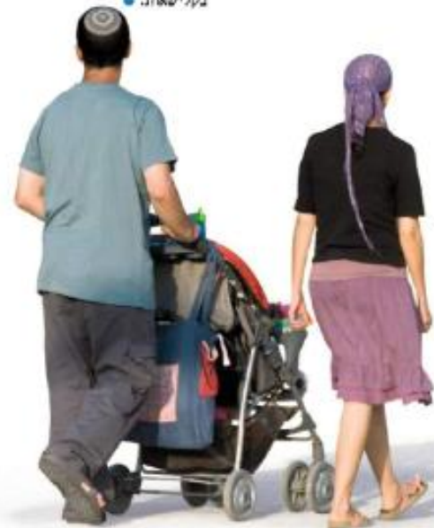
צטרים מטילים ברתמים ל'עולם לא המוקד לביטוח נדל"ן

מי שצלוה לא מומן את התהליך הזה היא מספחה