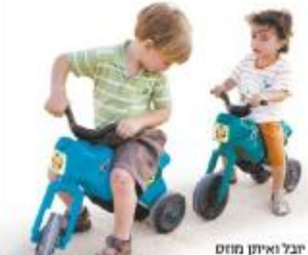
יעל ואיתן זום על ה"בימבות"