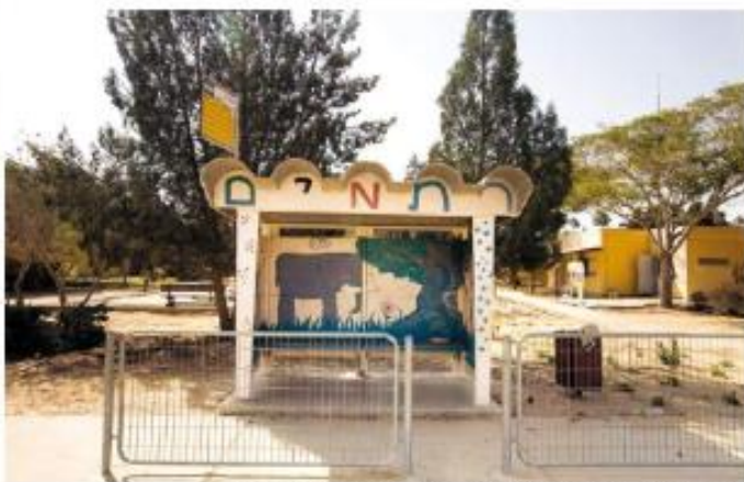
תחנת האוטובוס בנייה לתחמים. כביש 6 קרוב את היישוב למרכז הארץ